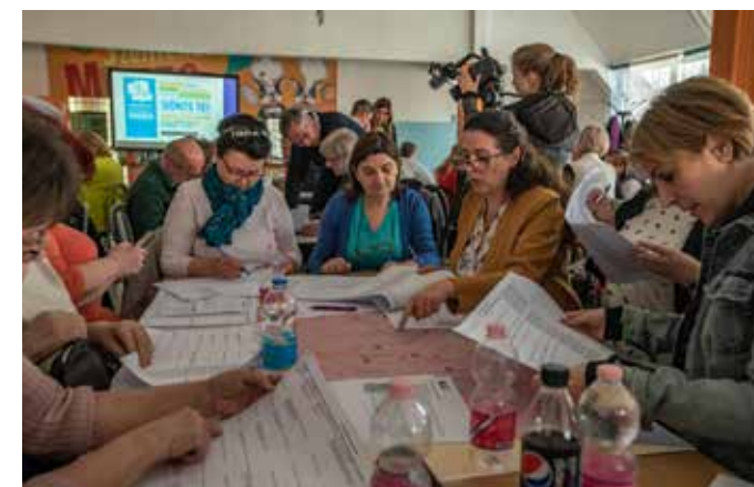
Közösségi gyűlés: készülnek a szavazólapok

Az új szemléletű városvezetés egyik legfontosabb elve érvényesül ebben a programban: a szentendreiek döntésekbe való bevonása, közvetlen részvétel a fejlesztési célok kitalálásában és a döntésekben. A városrészekből beküldött javaslatokkal kifejezésre jutnak a közvetlen lakókörnyezettel kapcsolatos fejlesztési igények, a szavazással pedig a többségi véleményben érvényre jut egy-egy javaslat hasznossága és a döntésekben való részvétel fontossága a lakóközösség számára.