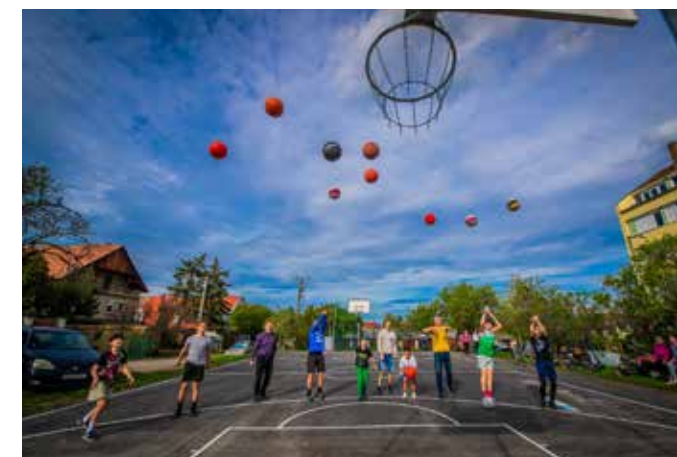
Kosárradobási versennyel zárult a fűzesparki pálya átadója

A közösségi gyűlés a következő fórum, ahol a szavazólapra kerülő javaslatokról városrészenkénti csoportokban döntenek, elmélyítve a párbeszédet a lakók között, illetve a lakók és a hivatali szakértők között. A városrészi önkormányzati képviselőjének irányításával zajló vitákban minden egyes javaslatot meghatá-