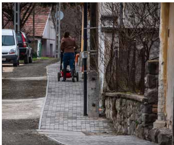
Járdafelújítás Izbégen a Szentlászlói úton

A legfontosabb, hogy külső pénzügyi források bevonásával fejleszteni tudjuk a város, ezen belül Izbég infrastruktúráját, ahogy ez sikerült is az elmúlt években. Hazai forrásból valósult meg az izbégi csapadékvíz-elvezetés fejlesztése, az önkormányzat finanszírozta az Izbégi Iskola tanterembővítéséhez szükséges közműfejlesztést. EU-s forrásból épült ki a Duna korzót és Izbéget is ösz-