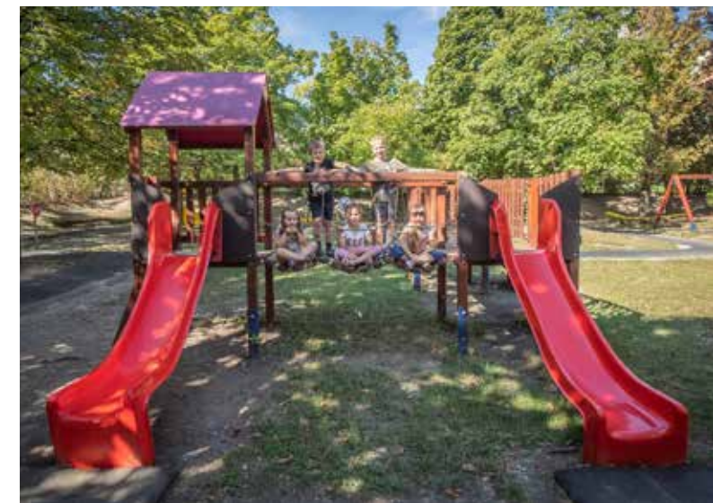
Új játékok a Püspökmajor óvodában

Sok kihívás van még előttünk az útfejlesztés, a közlekedésbiztonság, a csapadék-vízvezetés és a parkolás területén is. Ezek megoldásán túl terveim között szerepel, hogy fejlesszük a természetjáró célállomásainkat a következő években – gondolok itt a Kőhegyre –, illetve olyan közösségi teret és játszóteret ala-